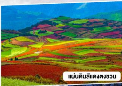
แผ่นดินสีแดงตงชาน