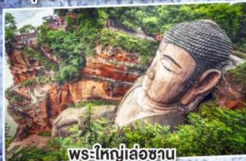
พระใหญ่เล่อซาน