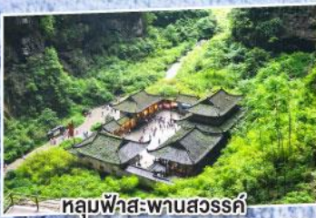
หลุมฟ้าสะพานสวรรค์