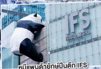
หมีแพนด้ายักษ์ปิ่นตึก IFS

พิเศษ! นั่งรถไฟความเร็วสูงฉงชิ่ง-เจียงตุ