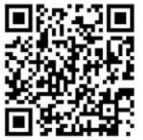
Photo Requirements for Chinese Visa Application