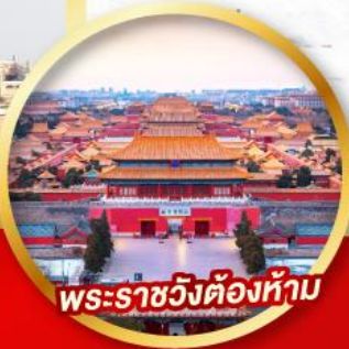
พระราชวังต้องห้าม