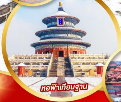
หอฟ้าเทียนถาน