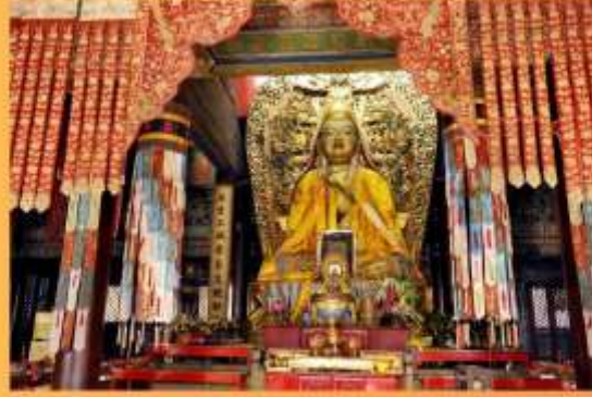
องค์องคปา