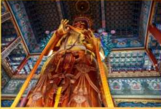
พระศรีอริยเมตไตรย