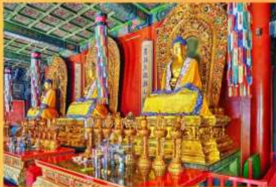
พระพุทธเจ้า 3 พระองค์