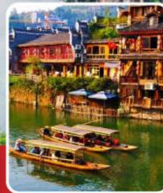
เมืองโบราณฝงหวง

เที่ยวฟิน 2 เมืองโบราณ พิชิตเขาวงกต แพนดอร่าของเมืองจีน