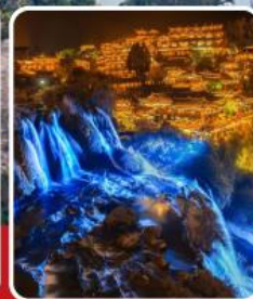
ฝูหลงเจิน