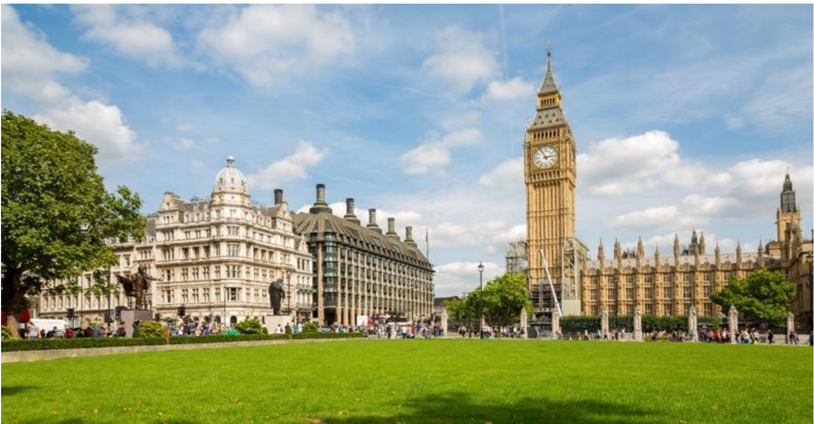
ลอนดอนในการถ่ายทอเดียเงการตีระฆังไปทั่วโลก

นำท่านเดินทางสู่ จัตุรัสทราฟัลการ์ (Trafalgar Square) จตุรัสกลางเมืองที่รายล้อมไปด้วยอาคารราชการสำคัญของเมืองลอนดอน นำท่านถ่ายรูปเป็นที่ระลึก กับ จัตุรัสรัฐสภา (Parliament Square) และ พระราชวังเวสต์มินสเตอร์ (Westminster Palace) หรือ ตึกรัฐสภาเวสต์มินสเตอร์ (Houses of Parliament) เป็นสถานที่ที่สภาสองสภาของรัฐสภาแห่งสหราชอาณาจักร (สภาขุนนาง และสภาสามัญชน) ใช้ประชุม สิ่งก่อสร้างส่วนใหญ่สร้างในคริสต์ศตวรรษที่ 19 แต่ก็ยังมีส่วนก่อสร้างเดิมเหลืออยู่บ้างเล็กน้อยรวมทั้งห้องพระโรงที่ในปัจจุบันใช้ในงานสำคัญๆ ได้รับการขึ้นทะเบียนให้เป็นมรดกโลกโดยองค์การสหประชาชาติ หรือ ยูเนสโก เมื่อปี ค.ศ. 1987 นำท่านถ่ายภาพคู่กับ หอนาฬิกาบิ๊กเบน (Big Ben) ของกรุงลอนดอนประเทศอังกฤษ ตั้งอยู่บนหอสูง 180 ฟุต หน้าปัดกว้าง 23 ฟุต ตัวเลขบอกเวลายาว 24 นิ้ว กระจกตีหนักถึง 14 ตัน สร้างขึ้นโดย เอ็ดมันด์ เมคเกตต์ เดนินสัน เป็นนาฬิกาที่ใหญ่ที่สุดในโลก เป็นศูนย์ควบคุมเวลามาตรฐานของโลกกรีนวิช ซึ่งใช้ในการบอกเวลาของโลกโดยผ่านทางวิทยุ BBC