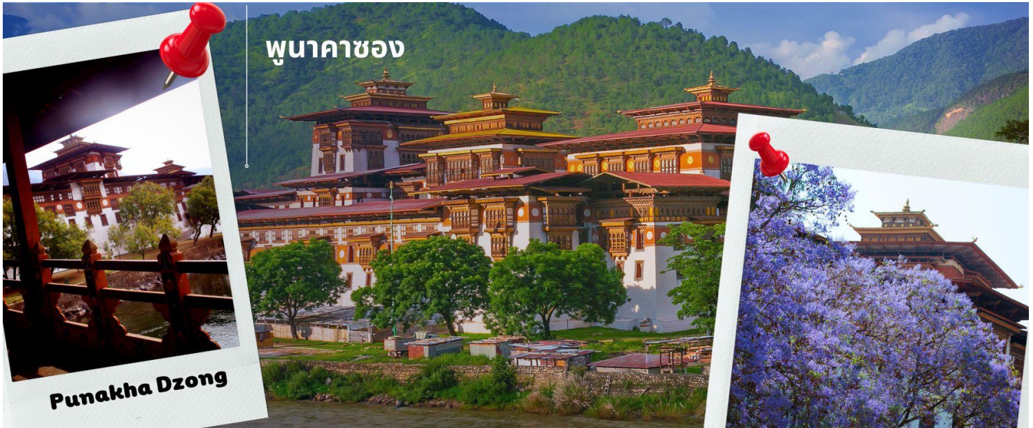
พุนาคาซอง

ปรากฏการประจำเมืองพุนาคา สร้างขึ้นในปี 1637 โดยซับุตรุง งาวังนัมเกล ซึ่งได้รับการขนานนามว่าเป็น พระราชวังแห่งความสุขอันยิ่งใหญ่ Palace of Great Happiness และเป็นหนึ่งในป้อมปราการที่สวยงามที่สุดในภูฏาน เป็นป้อมที่สร้างเป็นอันดับสองของภูฏาน ในอดีตเมื่อครั้งเมืองพุนาคายังเป็นเมืองหลวง ป้อมแห่งนี้ได้ถูกใช้เป็นที่ทำการของรัฐบาล ปัจจุบันเป็นที่พักในฤดูหนาวของพระชั้นผู้ใหญ่ ป้อมนี้ตั้งอยู่ ณ บริเวณที่แม่น้ำ Pho chu และ แม่น้ำ Mo chu ไหลมาบรรจบกัน อีกทั้งยังเป็นสถานที่ที่ท่านซับุตรุง งาวัง นัมเกล มรณภาพที่นี้ และปัจจุบันก็ได้เก็บรักษาร่างของท่านอยู่ภายใน