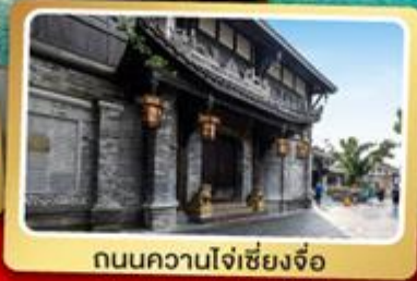
ถนนควานโจ๋เซียงจื่อ