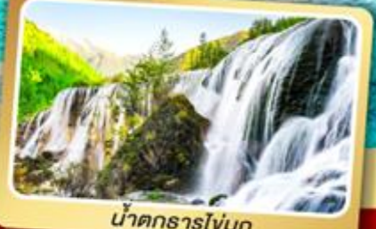
น้ำตกธารโง่บูก

ชมโชว์เปลี่ยนหน้ากาก แบบพิเศษ สุกี่หม่าล่าแสดงจบ