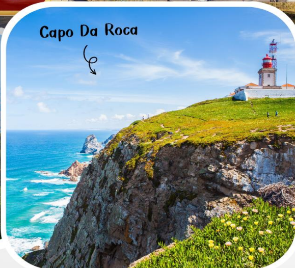
Capo Da Roca