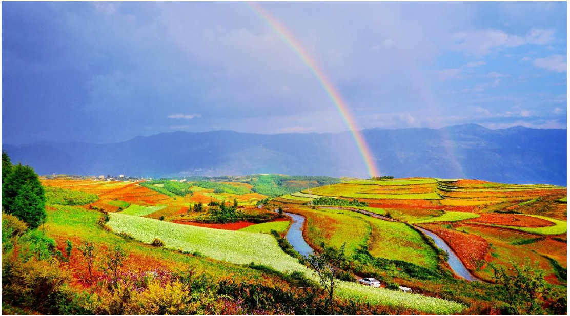
อีกแห่งของประเทศ

ภาพความประทับใจของภูเขาบริเวณนี้มีธาตุเหล็ก และแร่ธาตุอื่นๆที่อุดมสมบูรณ์ เมื่อเจอออกซิเจนได้เกิดปฏิกิริยาออกซิเดชันกลายเป็นสีแดง เมื่อกระทบกับแสงแดดเป็นภาพที่งดงามมากๆ ตงชวณยังเป็นดินแดนบริสุทธิ์ที่รู้จักกันในหมู่นักถ่ายภาพรูปเงินและชาวต่างชาติต่างยกย่องให้เป็นจุดที่มีภูมิทัศน์สวยงามที่สุด