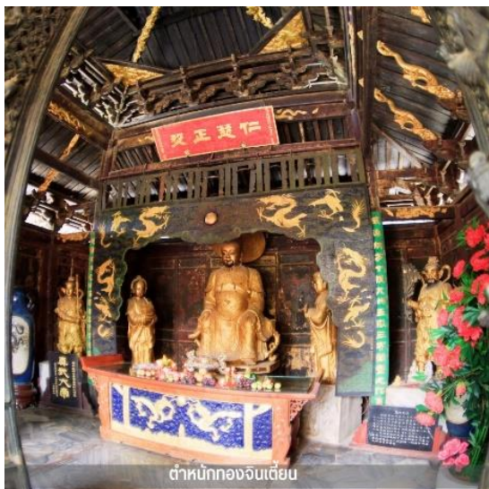
ตำหนักทองจีนเตี้ยน

กลางวัน บริการอาหารกลางวัน ณ ภัตตาคาร จากนั้นนำท่านเดินทางกลับ คุนหมิง