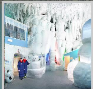
"KAMIKAWA ICE PAVILLION"