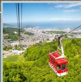
"MT. TENGU ROPEWAY"