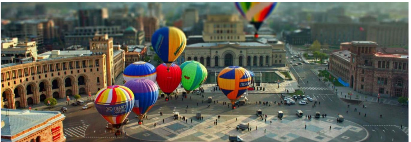
เทียบท่า

👉 นำท่านเข้าสู่โรงแรมที่พักโรงแรม 4 ดาว ณ เมือง เยเรวาน, ประเทศอาร์เมเนีย ANI PLAZA หรือ