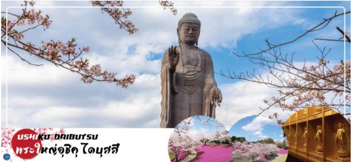
USHIKU DAIBUTSU พระใหญ่อุซึกุ ไดบุตสึ

นำท่านนมัสการ พระใหญ่อุซึกุ ไดบุตสึ (Ushiku Daibutsu) (ใช้เวลาเดินทางประมาณ 50 นาที) เป็นพระพุทธรูปปางยืนที่สูงที่สุดของประเทศญี่ปุ่น และเคยเป็นรูปปั้นที่สูงที่สุดในโลกที่ถูกบันทึกไว้โดยหนังสือบันทึกสถิติโลกกินเนสบุ๊ค (Guinness Book of world records) เมื่อปี ค.ศ. 1995 ด้วยจากความสูงถึง 120 เมตร ทำให้สามารถมองเห็นได้ตั้งแต่ใจกลางเมืองโตเกียวเลยทีเดียว สามารถเข้าไปยังบริเวณภายในรูปปั้นและขึ้นไปยังจุดที่เป็นหอสังเกตการณ์ในระดับความสูงที่ 85 เมตร ซึ่งจะอยู่ตรงส่วนของหน้าอกพระพุทธรูป เป็นจุดที่สามารถมองเห็น วิวในมุมด้านกว้างได้ ทั้งหมด บนชั้นนี้จะมีกระจกที่เป็นช่องหน้าต่างอยู่ด้วยกัน 4 ด้าน และมองเห็นภูเขาไฟฟูจิได้จากตรงนี้อีกด้วย (ราคาไม่รวมค่าเข้าพระพุทธรูปด้านใน) บริเวณใกล้เคียงจะมีสวนขนาดใหญ่เนื่องจากต้นไม้ในสวนสวนมากเป็นต้นซากุระ ในช่วงที่ซากุระบานที่นี่จึงสวยงามเป็นพิเศษ เรียกได้ว่ามาไหว้พระอย่างเดียวก็อิ่มบุญแล้ว แถมยังได้อิ่มใจไปกับวิวสวยๆอีกด้วย (ราคาไม่รวมค่าเข้าชมสวน)