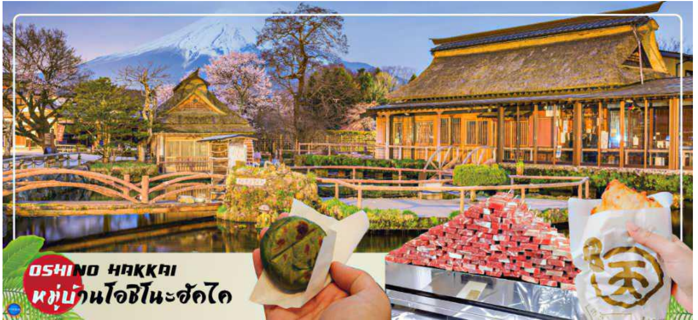
OSHINO HAKKAI หมู่บ้านโอชิโนะฮักไก

นาทิจิ เป็นจุดท่องเที่ยวสำคัญอีกสถานที่หนึ่ง โดยมีวิวภูเขาไฟฟูจิสีขาวตัดกับพื้นหลังสีฟ้า เป็นภาพที่สวยงามมาก โอะชิโนะฮักไกเป็นหมู่บ้านเล็กๆ ประกอบด้วยบ่อน้ำ 8 บ่อในโอชิโนะ ตั้งอยู่ระหว่างทะเลสาบคาวากูจิโกะ กับทะเลสาบยามานาคาโกะ บ่อน้ำทั้ง 8 นี้เป็นน้ำจากหิมะที่ละลายในช่วงฤดูร้อน ที่ไหลมาจากทางลาดใกล้ภูเขาไฟฟูจิผ่านหินลาวาที่มีรูพรุนอายุกว่า 80 ปี ทำให้น้ำใสสะอาดเป็นพิเศษ นอกจากนี้ยังมีร้านอาหาร ร้านจำหน่ายของที่ระลึก และซุ้มรอบๆบ่อ ที่ขายทั้งผัก ขนมหวาน ผักดอง งานฝีมือ และผลิตภัณฑ์ท้องถิ่นอื่นๆ