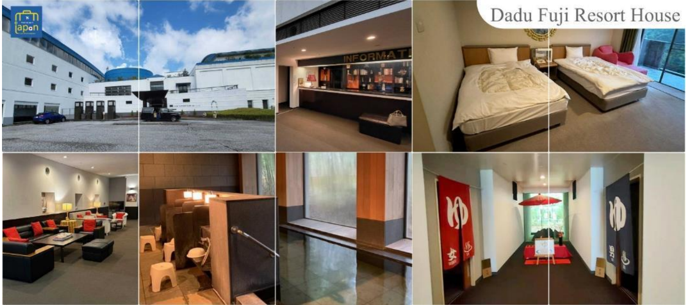
Dadu Fuji Resort House

หลังอาหารให้ท่านได้ผ่อนคลายกับการแช่น้ำแร่ธรรมชาติ เชื่อว่าถ้าได้แช่น้ำแร่แล้ว จะทำให้ผิวพรรณสวยงามและช่วยให้ระบบหมุนเวียนโลหิตดีขึ้น