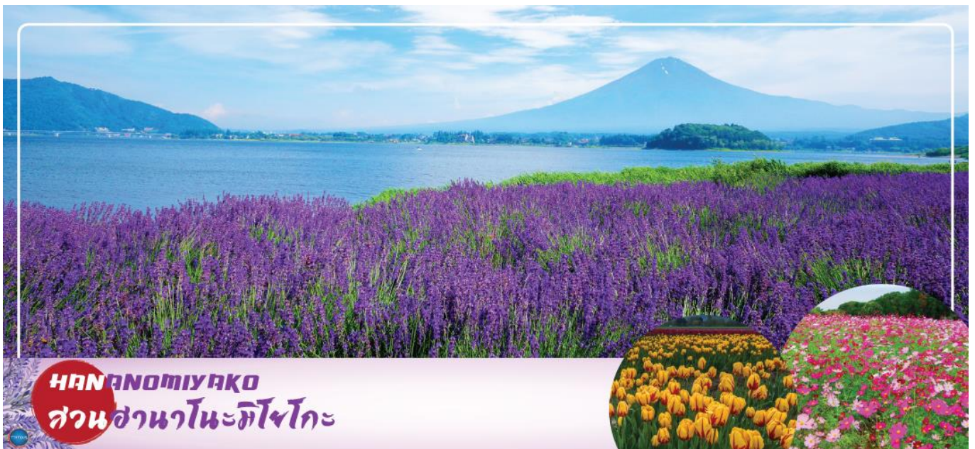
HANANOMIYAKO สวนฮานะโนะมียาโกะ

เมืองยามานาชิ – สวนดอกไม้ฮานะโนะมียาโกะ หรือ เทศกาลชมดอกกลาเวนเดอร์ที่ทะเลสาบคาวากุจิ (ตามฤดูกาล) – พิธีซงชาญี่ปุ่น – กรุงโตเกียว – ย่านโอไดบะ – ห้างไดเวอร์ซิตี – เมืองนาริตะ – อีออนมอลล์ นาริตะ