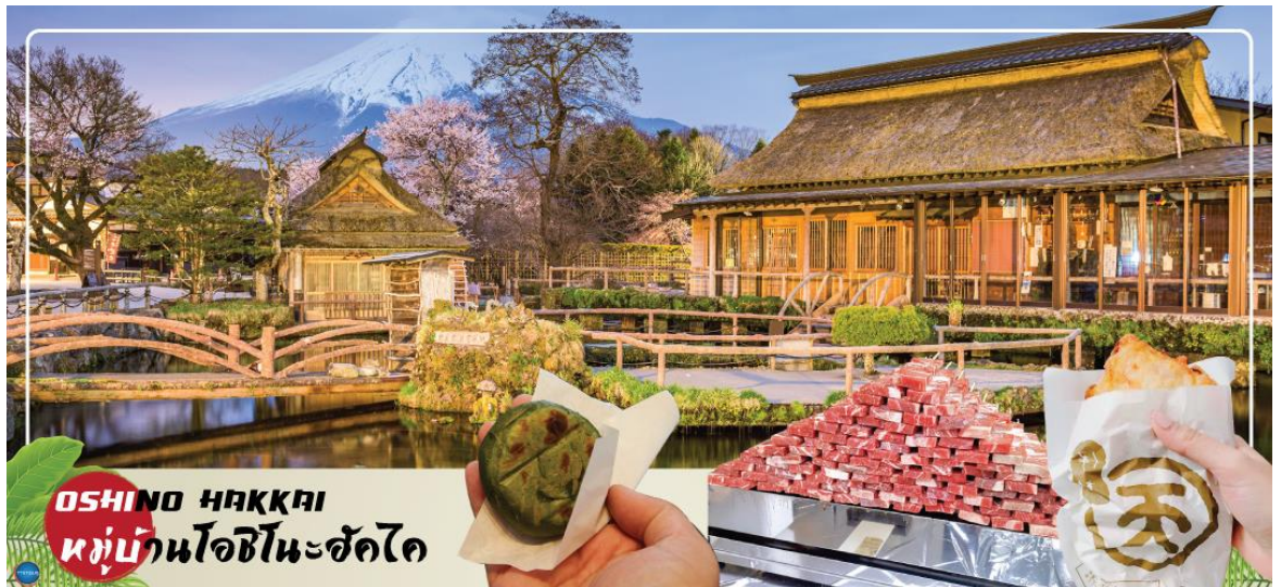
OSHINO HAKKAI หมู่บ้านโอชิโนะฮัคไค

นำท่านเข้าสู่ที่พัก (ใช้เวลาเดินทางประมาณ 20 นาที)