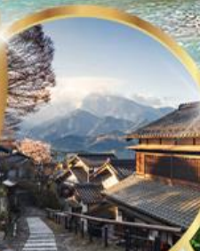
มาโกเมะจุกุ