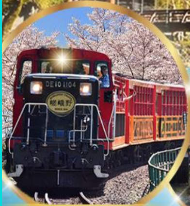
รถไฟสายโรแมนติก