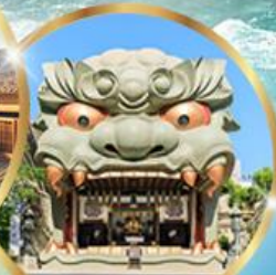
ศาลเจ้านิมะ ยาชากะ