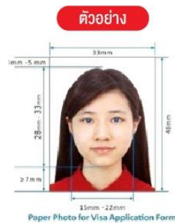
Paper Photo for Visa Application Form