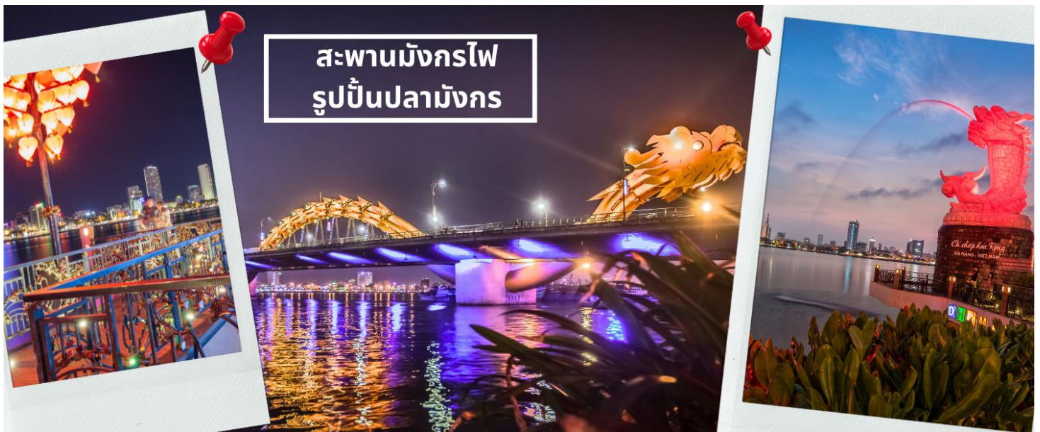
สะพานมังกรไฟ รูปปั้นปลามังกร

จากนั้นนำท่านชม สะพานแห่งความรัก ที่นิยมของหนุ่มสาวคู่รักกันมาซื้อกุญแจใส่คล้องใส่สะพาน จากนั้นนำท่านชม รูปปั้นปลามังกร ที่เป็นสัญลักษณ์ของเมืองดานัง เมืองที่กำลังจากปลากลายเป็นมังกรในระยะใกล้ เชิญท่านเพลิดเพลินกับความอลังการของ สะพานมังกรไฟ ที่มีความยาวถึง 666 เมตร เป็นสะพาน 6 เลนส์ ซึ่งเป็นสะพานที่ตระการตามากที่สุดของเวียดนามในเวลานี้โดยการแสดงนี้จะเริ่มเวลา 21.00น. ของวันเสาร์และอาทิตย์เท่านั้น