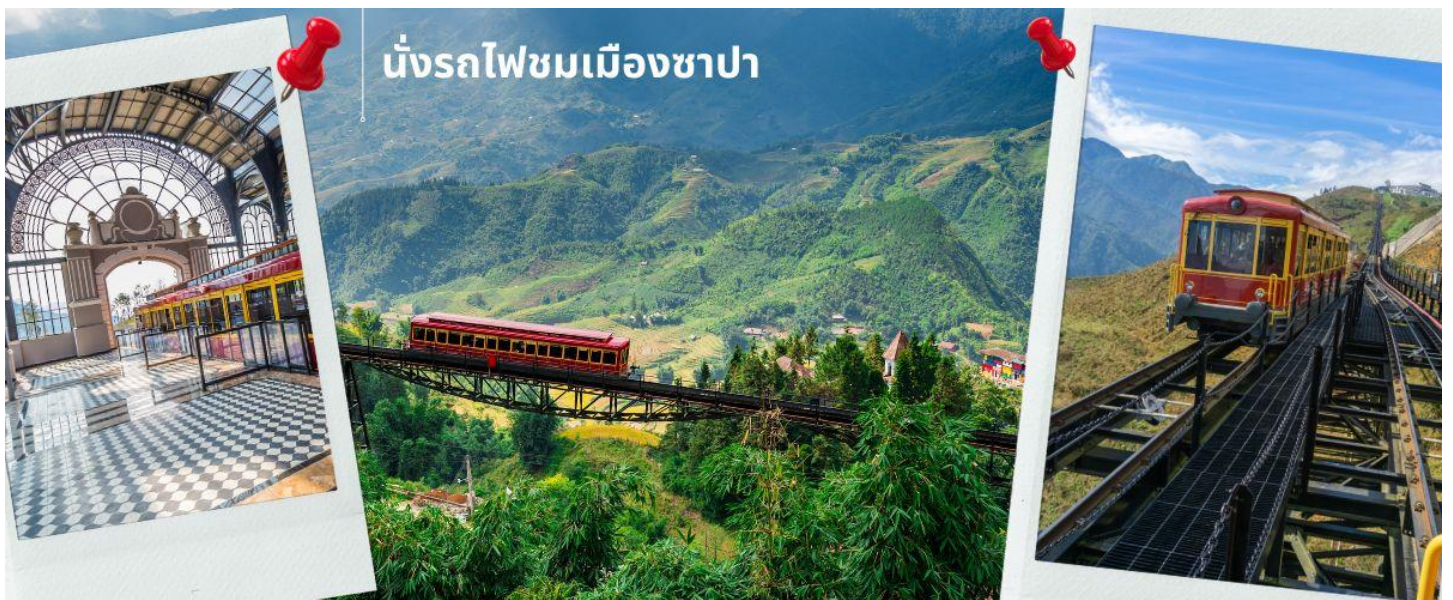
นั่งรถไฟชมเมืองซาปา

นำท่าน นั่งรถไฟชมเมืองซาปา (รวมค่ารถไฟชมเมือง) ท่านจะได้พบกับวิวทิวทัศน์ของเมืองซาปาที่เต็มไปด้วยความสดชื่น และสุดกลิ่นอายธรรมชาติ และยังตื่นตาไปด้วยวิวกุเขา และนาขั้นบันได ที่มีชื่อเสียงของเมืองซาปาอีกด้วย ความยาวประมาณ 2 กิโลเมตร โดยใช้เวลาประมาณ 20 นาทีเพื่อไปสู่สถานีขึ้นกระเช้าที่จะนำท่านขึ้นสู่ยอดเขาฟานซีปัน