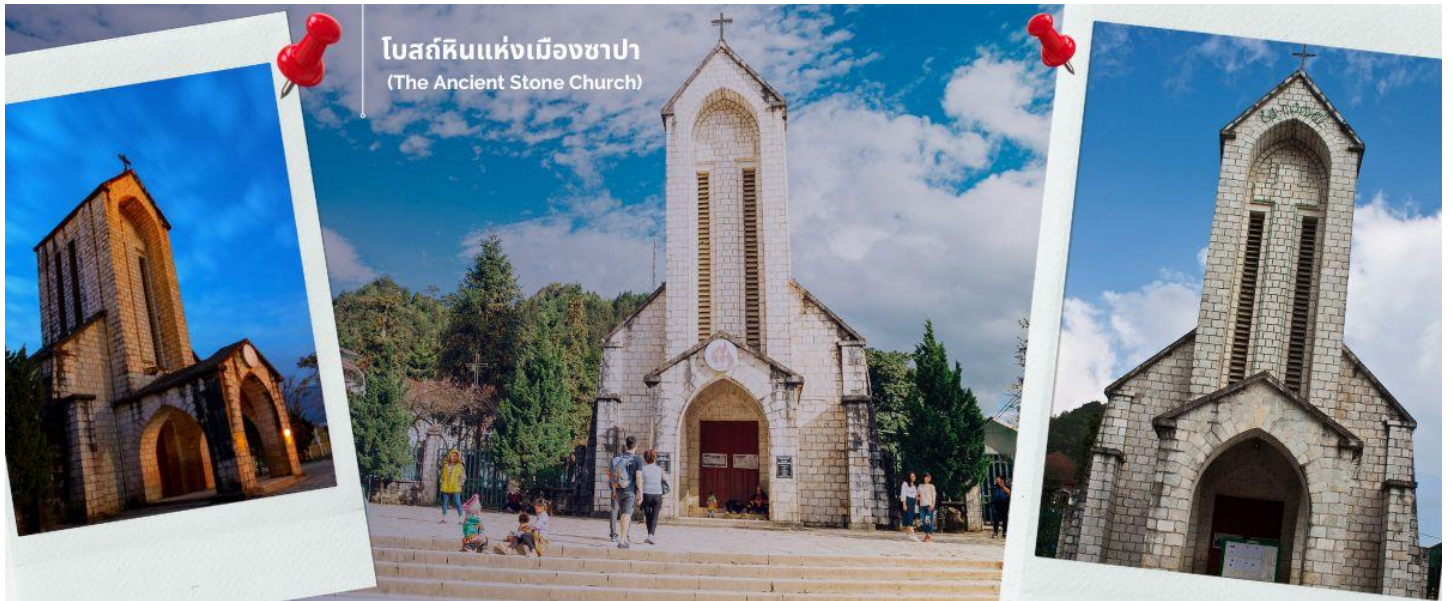
โบสถ์หินแห่งเมืองซาปา (The Ancient Stone Church)

ในตอนนี้ชาวฝรั่งเศสจะย้ายกลับไปแล้ว แต่โบสถ์แห่งนี้ก็ได้รับการอนุรักษ์เอาไว้เป็นอย่างดีและชาวซาปาที่