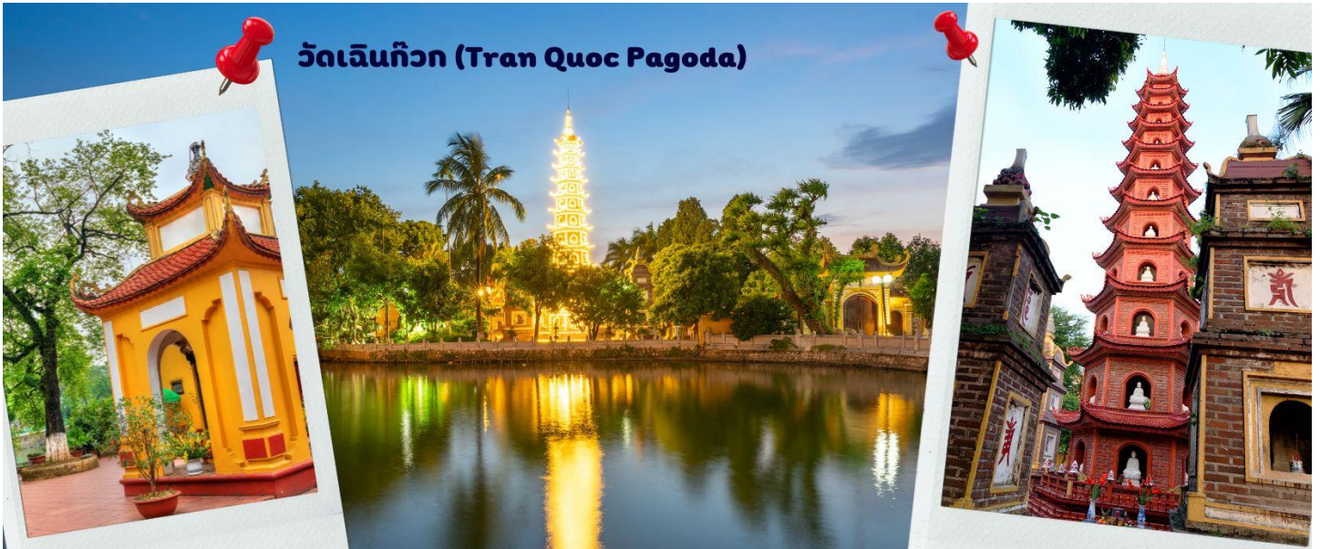
วัดเจ็ญก๊วก (Tran Quoc Pagoda)

จากนั้นนำท่านไป วัดเจ็ญก๊วก (Tran Quoc Pagoda) เป็นวัดที่อยู่ใจกลางเมืองของเวียดนาม ใกล้ชิดกับทะเลสาบตะวันตกของเมืองฮานอย สร้างด้วยสถาปัตยกรรมจีนโบราณ มีความร่มรื่น และบรรยากาศดี จึงเป็นที่นิยมของนักท่องเที่ยวทั้งที่ชื่นชอบความงามและมีศรัทธาในพระพุทธศาสนา จากภาพมุมสูงของสถานที่ตั้ง ที่นี่เหมือนตั้งอยู่บนเกาะที่ยื่นลงไปในทะเลสาบ แต่มีเส้นทางคมนาคมเข้าถึงที่ สิ่งปลูกสร้างมีการวางผังเป็นอย่างดี ใช้สีสันทึกลมกลืนในโทนสีเหลือง น้ำตาล ตัดกับสีเขียวของต้นไม้ใหญ่ที่โอบล้อมอยู่ในมุมถ่ายภาพจากอีกฝั่งหนึ่ง จะเห็นสิ่งปลูกสร้างสไตล์จีน และเจดีย์หลายชั้นโดดเด่น มีภาพที่สะท้อนลงสู่ผืนน้ำ เป็นภูมิทัศน์ที่งดงามทั้งยามกลางวันและยามค่ำคืนที่มีการเปิดไฟส่องสว่าง