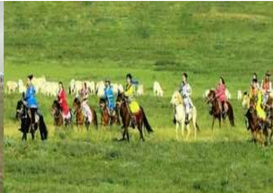
วันรุ่งขึ้น

ที่พัก กระโจมสไตล์มองโกลในอุทยานทุ่งหญ้า ระดับ 4 ดาว (ห้องน้ำในตัว) *ไม่มีห้องพักเสริมเตียง*