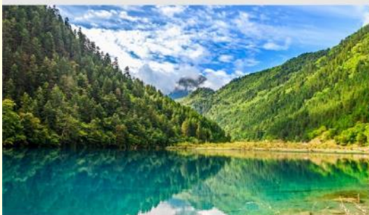
อุทยานฯจิวจ้ายโกว