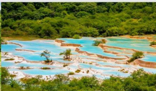
อุทยานฯ หวงหลง