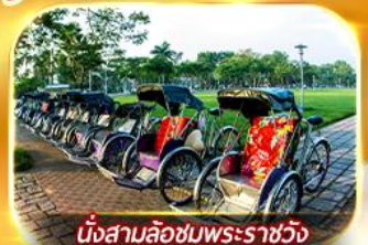
นั่งสามล้อชมพระราชวัง

สัมผัสความสวยงามหมู่บ้านสไตล์ฝรั่งเศสที่บานาฮิลล์ วัดเทียนมู่ พระราชวังเว้ สัมผัสเมืองโบราณฮอยอัน ล่องเรือกระด้ง