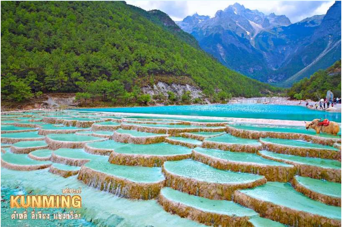
น้ำทิพย์ KUNMING ต้าชี่ สีเจิ้ง แสงกวีสี

อิสระถ่ายรูปเก็บความประทับใจอย่างเต็มอิม และชมความงดงามผืนน้ำสีเทอควอยซ์ของ ทะเลสาบไปสุยเหอ ทะเลสาบที่อยู่อีกด้านหนึ่งของภูเขาหิมะมังกรหยก น้ำในทะเลสาบแห่งนี้ไหลลงมาจากการละลายของหิมะบนภูเขาหิมะมังกรหยก สามารถดื่มชมความสวยของทะเลสาบได้ตลอดระยะทาง 3 กิโลเมตร หรือจะเลือกนั่งรถรับส่งได้ตามสะดวกไปยังจุดท่องเที่ยวยอดนิยม (รวมค่ารถแบตเตอร์) ระหว่างทางเดินเลียบทะเลสาบจะพบเห็นคู่รักชาวจีนที่นิยมมาถ่ายพรีเวดดิ้ง และมีเจ้าหน้าที่คอยพาจามริมาบริการให้นักท่องเที่ยวได้ถ่ายรูป (ไม่รวมค่าบริการถ่ายรูป ราคาประมาณ 50 หยวน)