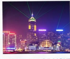
SYMPHONY OF LIGHT