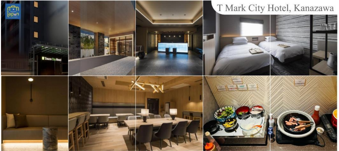
T Mark City Hotel, Kanazawa

T MARK CITY HOTEL, KANAZAWA หรือเทียบเท่าระดับเดียวกัน