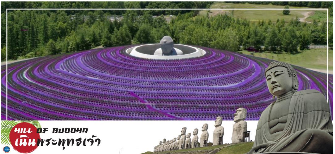
HILL OF BUDDHAS เนินพระพุทธรเจ้า

วันที่สอง ท่าอากาศยานนิวซีโดเสะ สอกไกโด – เมืองซัปโปโร – เนินพระพุทธรเจ้า – เมืองอาซาฮิดาว่า – อีออน อาซาฮิดาว่า