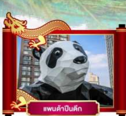
แพนด้าปิ่นตึก