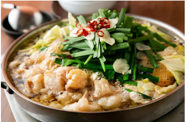
ร้านอาหารย่านยะไต (YATAI)

เย็น อิสระรับประทานอาหารค่ำตามอัธยาศัย เพื่อให้ท่านได้ช้อปปิ้งอย่างเต็มที่ (มีไกด์แนะนำ) ➡ พักค้างคืน ณ โรงแรม Nishitetsu Inn Hotel (★★★★) หรือเทียบเท่า ใจกลางย่านเทนจิน