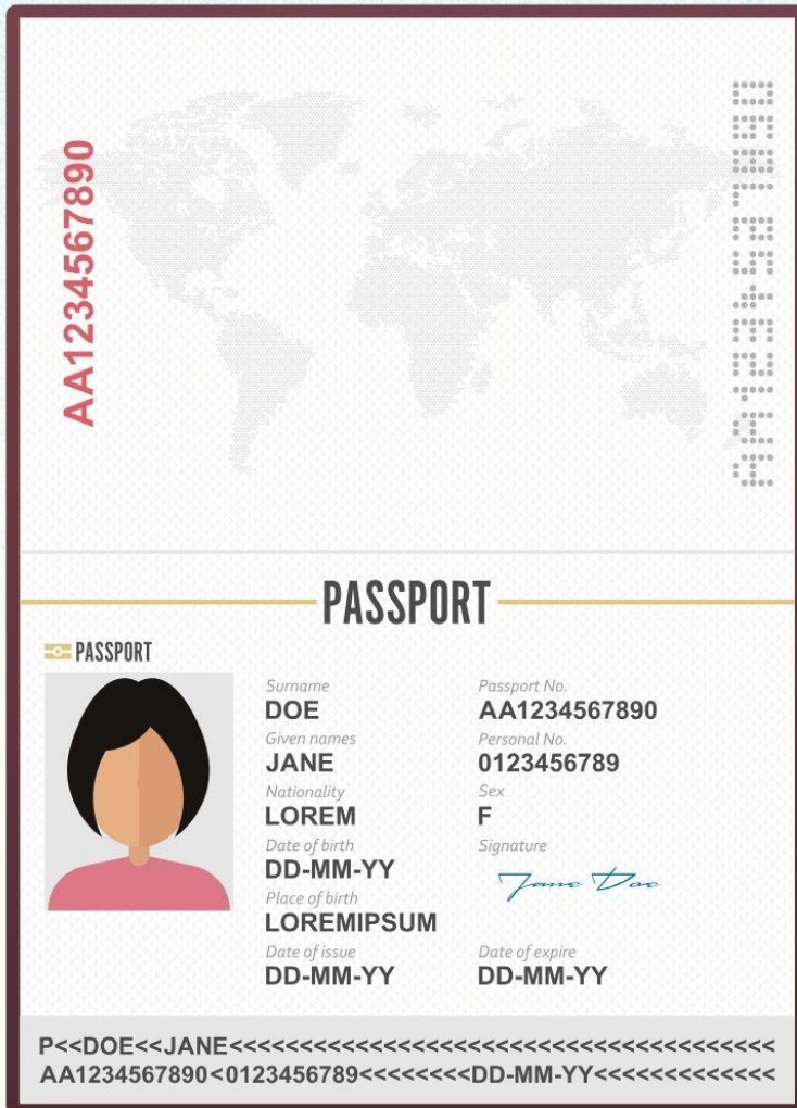
ตัวอย่างโฟล์สแกน รูปถ่าย