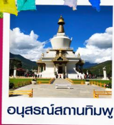
อนุสรณ์สถานทิมพู