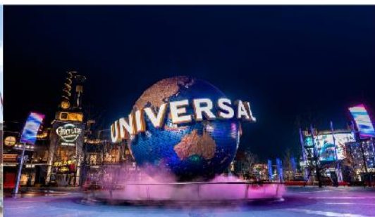
ยูนิเวอร์เซล ปักกิ่ง รีสอร์ท