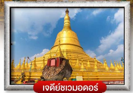
เจดีย์ชเวมอดอร์

เมนู สุดพิเศษ | กุ้งแม่น้ำเผา + บุฟเฟ่ต์นานาชาติ