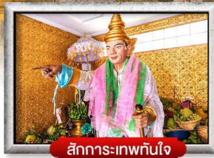
สักการะเทพทันใจ