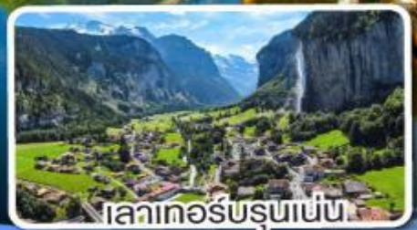
เลาเทอส์บรุนเนน