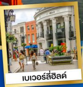
เบเวอร์ลี่ฮิลล์