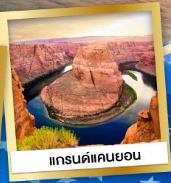
แกรนด์แคนยอน