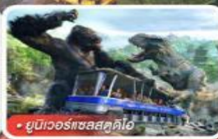
ยูนิเวอร์แซลสตูดิโอ