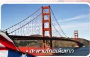
สะพานโกลเดนเกต