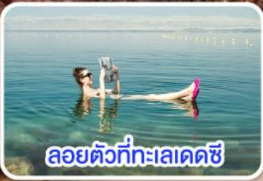
ลอยตัวที่ทะเลเดดซี