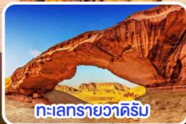
ทะเลทรายวาดีรัม