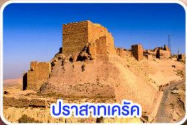
ปราสาทเกร็ด