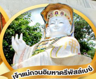
เจ้าแม่กวนอิมหาดริพัลส์เบย์