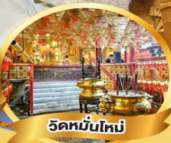
วัดม้านโหม่