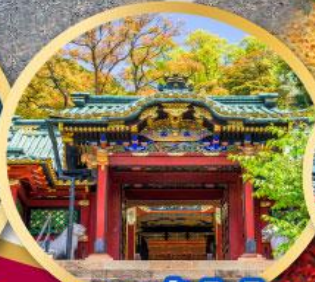
ศาลเจ้าโทโชคุ