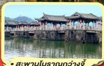
• สะพานโบราณกว่างจี้