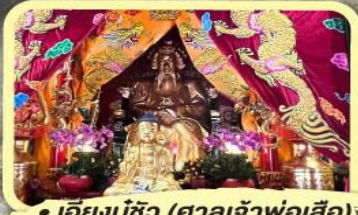
• เอียงบู๊ซิว (ศาลเจ้าพ่อเสือ)