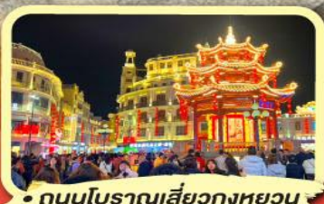
• ถนนโบราณเสี่ยวกงหยวน