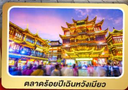
ตลาดร้อยปีเงินหวังเมียว