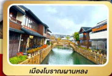
เมืองโบราณผานหลง