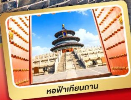
หอฟ้าเทียนถาน