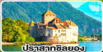
ปราสาทซิลยอง

ไม่ใช่ทะเลแต่เป็นเขา ขึ้นกระเช้าข้ามประเทศ อิตาลี สวิตเซอร์แลนด์ 7วัน 4 คืน