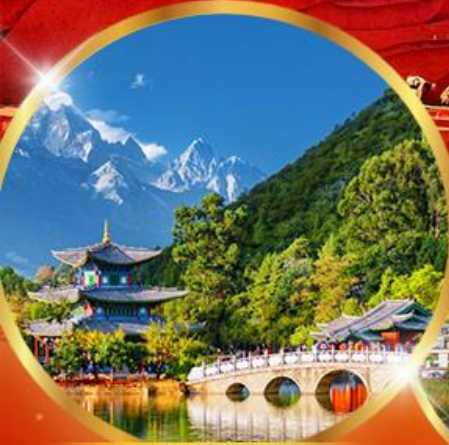
สระมิงกรดำ

25,919 ราคา เริ่มต้น รวมภาษีมูลค่าเพิ่ม 7% บาท