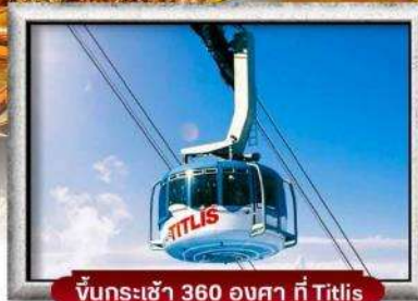
ขึ้นกระเช้า 360 องศา ที่ Titlis