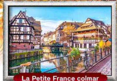
La Petite France colmar

บินหรู สายการบิน Full Service | พิเศษ! หอยเอสคาโก้