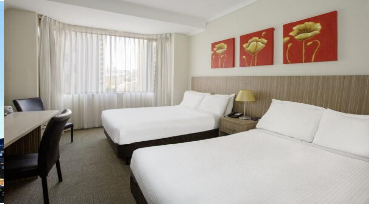
(โรงแรมย่านกลางเมือง ใกล้แหล่งช้อปปิ้ง เดินทางสะดวก) *รูปภาพเพื่อการโฆษณา*