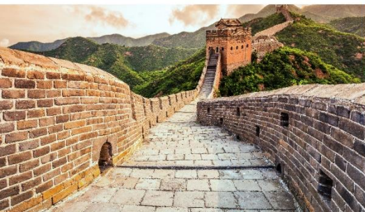
กำแพงเมืองจีน