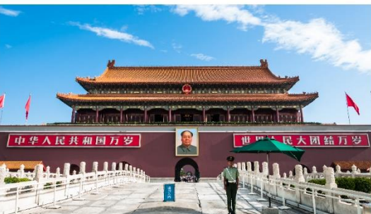
พระราชวังต้องห้ามกุ๊กง