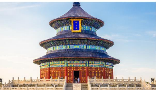
หอสักการะฟ้าเทียนถาน