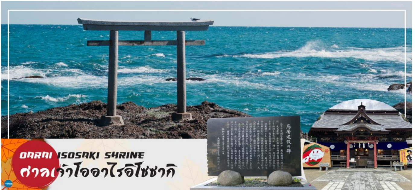
OARAI ISOSAKI SHRINE ศาลเจ้าโออาไรอิโซซากิ

08.10 น. เดินทางถึง ท่าอากาศยานนานาชาตินาริตะ ประเทศญี่ปุ่น หลังจากผ่านขั้นตอนศุลกากร เรียบร้อยแล้ว แล้ว (เวลาที่ญี่ปุ่น เรียกว่าเมืองไทย 2 ชั่วโมง กรุณาปรับนาฬิกาของท่านเพื่อความสะดวกในการนัดหมายเวลา) ***สำคัญมาก!! ประเทศญี่ปุ่นไม่อนุญาตให้นำอาหารสดจำพวก เนื้อสัตว์ พืช ผัก ผลไม้ เข้าประเทศ หากฝ่าฝืนมีโทษปรับและจับหลังผ่านขั้นตอนการเข้าประเทศแล้ว นำท่านออกเดินทางสู่ จังหวัดอิบารากิ (Ibaraki) (ใช้เวลาเดินทางประมาณ 1.40 ชั่วโมง) ตั้งอยู่ในภูมิภาคคันโตของเกาะฮอนชู ประเทศญี่ปุ่น อิบารากิซึ่งอยู่ไม่ห่างจากโตเกียว เต็มไปด้วยสถานที่ท่องเที่ยวอันสวยงามมากมาย โดยเฉพาะเทศกาลที่เกี่ยวกับดอกไม้ ที่มีให้ชมตลอดทั้งปี นอกจากนี้ยังเป็นจังหวัดที่มีการผลิตนัตโตะ หรือ ถั่วเน่าญี่ปุ่น มากที่สุดในญี่ปุ่นอีกด้วย