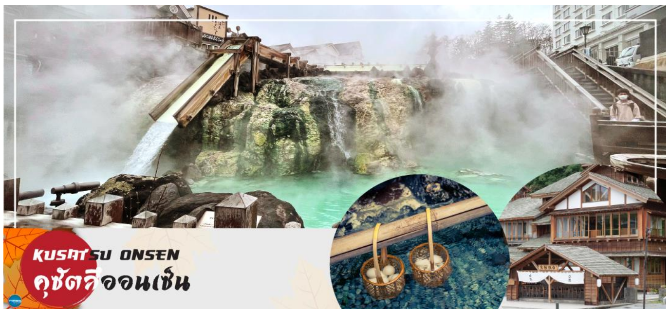
KUSATSU ONSEN คุซัตสึออนเซ็น

นำท่านเดินชม ยุมาทาเกะ (Yubatake) ที่นับได้ว่าเป็นเขตน้ำพุร้อนที่เปรียบเสมือนสัญลักษณ์ใจกลางเมืองแห่งนี้ก็ว่าได้ อีกสิ่งหนึ่งที่ทำให้เขตยุมาทาเกะมีความพิเศษ นับเป็นหนึ่งในแหล่งน้ำพุร้อน