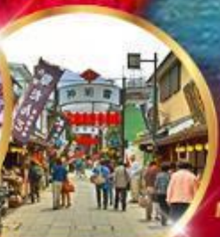
ย่านโบราณ ชิชะมาตะ