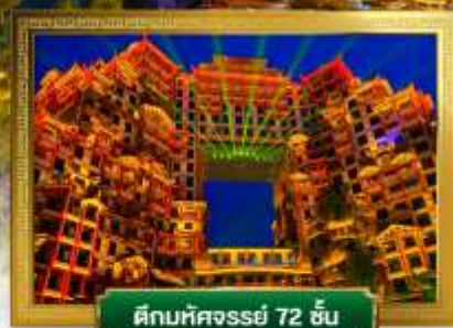
ตีพิมพ์มหัศจรรย์ 72 ชั้น