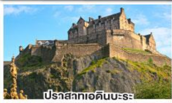
ปราสาทเอดินบะระ