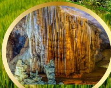
ถ้ำสวรรค์